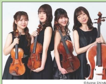
カルテット・プリマベラ