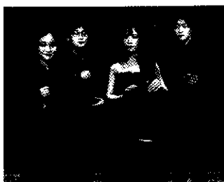
の池上白鷺/サントリーホール