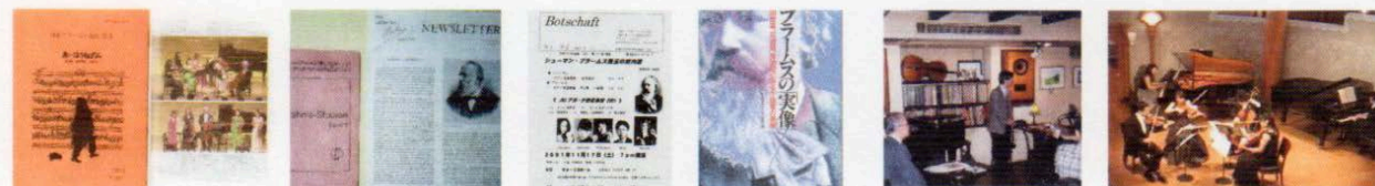
年会誌 海外B協会と会誌交換 会報 ブラームスの実像 レクチャー&コンサート 「湖畔のブラームス」河口湖

海外のブラームス協会はドイツ、オーストリアなどブラームスが訪れた各地にあり、例外である日本とアメリカのブラームス協会も活発な活動を行っている。「年会誌」などの情報交換を行っている。